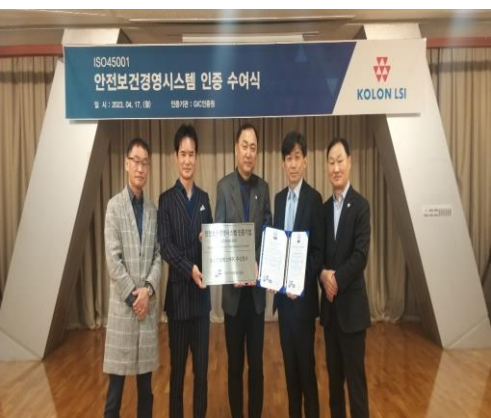
(주)코오롱LSI ISO 45001 인증수여식

ISO 9001 / 14001 / 45001 / 37001 / 37301 / ISO 22000 / 22716 / 10002 / 27001 / 27701 / 20000-1 / 13485 / 22301 / 50001 총 14개 표준에 대해 인증심사를 수행하고 있는 공신력 있는 인증기관 으로 신뢰성과 공정성을 지속적으로 보장 받으실 수 있으며, 고객과 함께 성장하는 전문컨설팅 기업이 되기 위해 노력하고 있습니다.